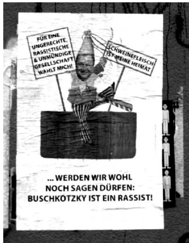
Plakate gegen Buschkowsky, entdeckt im Schillerkiez