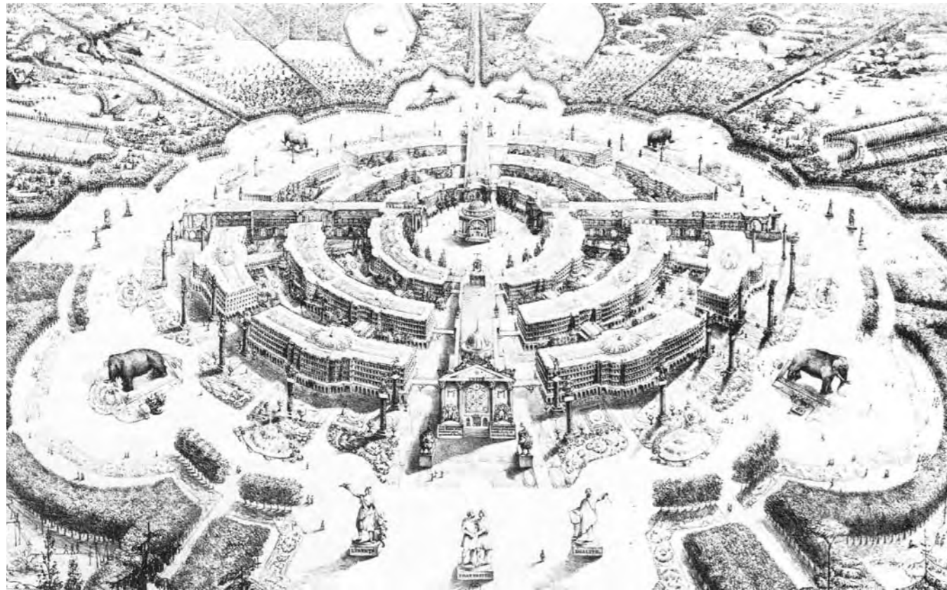
Charles Fourier – Die garantistische Stadt

Einteilung in Charakter- und Altersgruppen sollte die berufliche Gliederung in Arbeitsserien abgeleitet werden, die allen Mitgliedern eine Vielzahl von Kommunikations- und Arbeitsmöglichkeiten bieten sollte. Architektonisch sollten neben individuellen Wohnungen, viele Kommunikationsräume und halböffentliche Räumlichkeiten existieren.