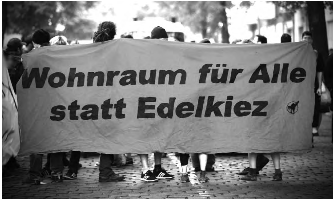
Vor der Weisestraße 47

Ebenfalls am Samstag, den 28. April 2012 wurde symbolisch auf die geplante Bebauung des Geländes im Bereich der Oderstraße aufmerksam gemacht. Mehrere Dutzend Menschen sperrten mit rot-weißem Flatterband den Bereich rund um die drei Gärten und den ganzen Grillplatz ab, um Teile der zukünftigen Baufelder zu markieren. Flyer mit Infos wurden an die Besucher verteilt, Transparente angebracht, mit einem Megafon wurden die Besucher des