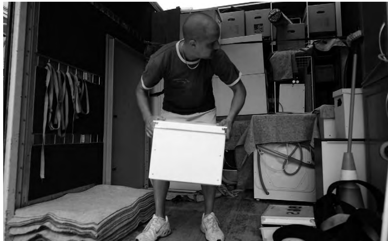
„Die Teupe ist Plötzensee mit Freigang.“

Link zur Teupe: http://www.gebewo.de/angebote-berlin/wohnungsnottfallhilfe-und-existenzsicherung/die-teupe.html