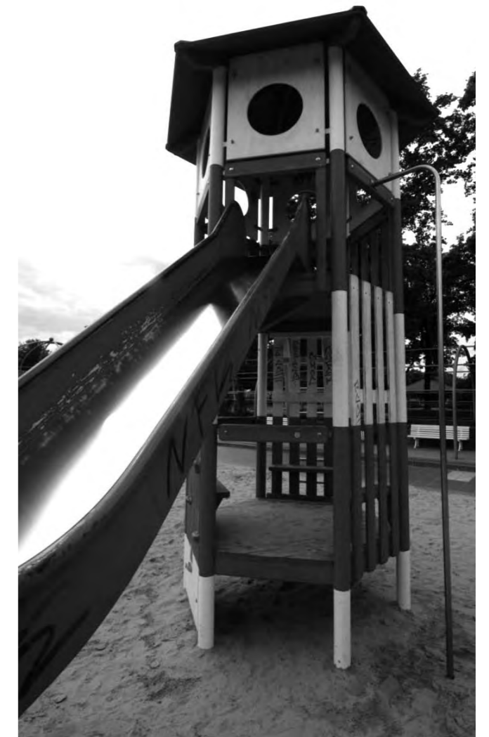
Spielplatz in der Hasenheide

http://www.junge-linke.org/drogenverbote-weg-damit http://www.sd-verein.de/prosd